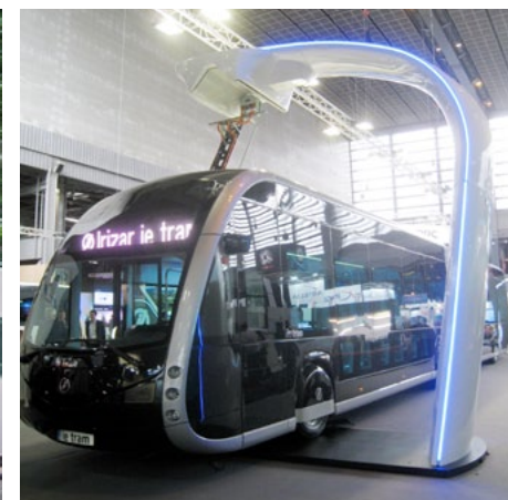
Le quattro linee BHNS di Amiens Rossa, verde e blu 100% elettriche