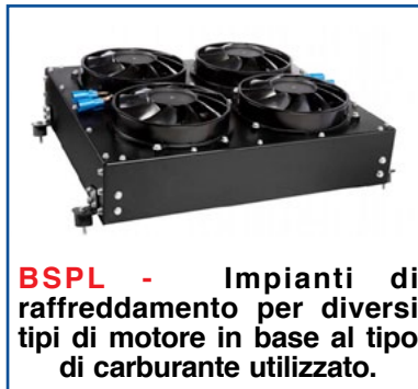
BSPL - Impianti di raffreddamento per diversi tipi di motore in base al tipo di carburante utilizzato.