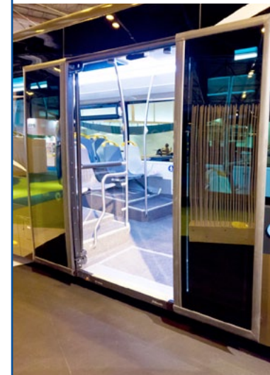
MASATS - Festeggia i suoi primi 50 anni e mostra l'ultima versione della porta scorrevole 028C.