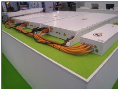
AKASOL - Nuova generazione del sistema di batterie Akasystem Oem per autobus elettrici.