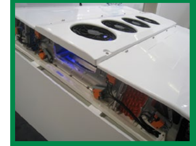
EBERSPÄCHER - Prosegue la sperimentazione sull'uso della CO2 come refrigerante nei gruppi clima. Sul mercato nel 2020.