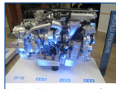
DAF - Riduce la velocità dei motori Paccar MX-11 e MX-13 per ottimizzare i consumi.