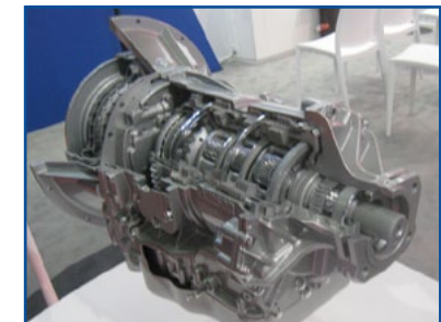
ALLISON - Sarà disponibile nel 2020 il nuovo cambio automatico a nove marce.