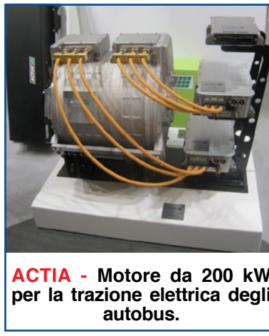
ACTIA - Motore da 200 kW per la trazione elettrica degli autobus.