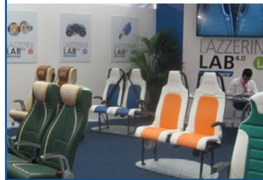
LAZZERINI - Sedili passeggero per ogni tipo di autobus.