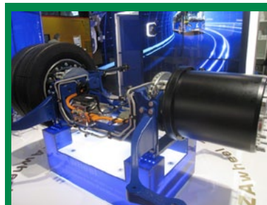
ZIEHL ABEGG - Seconda generazione del sistema ZAwheel, ora più potente e per ruote gemellate.