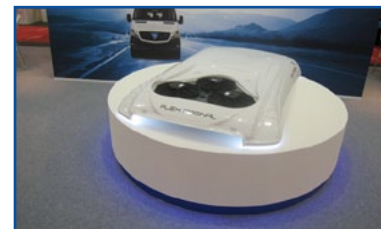
ALEX - Unità di climatizzazione a tetto serie Aero 4500 con protezione UV.