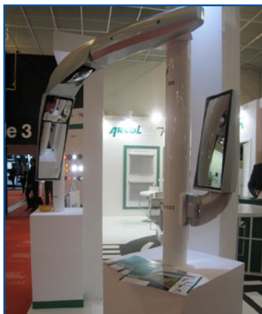
ARCOL - Specchi retrovisori completamente integrati per autobus da turismo.