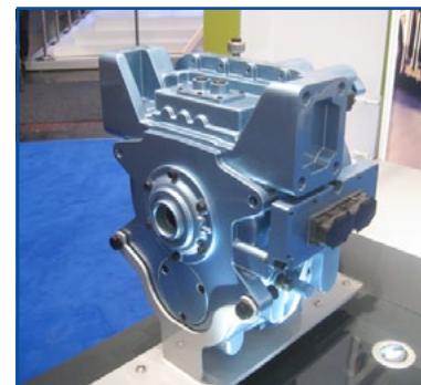
EATON - Per autobus urbani fino a 18 tonnellate la trasmissione a quattro velocità con capacità di coppia fino a 1.300 Nm.