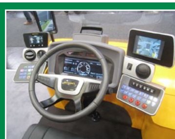
CONTINENTAL - Per la divisione VDO, tutti i sistemi di assistenza alla guida, compresi gli specchi retrovisivi digitali. Per i pneumatici, la nuova frontiera sono le mescole a base di tarassaco.