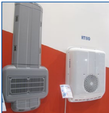
AUTOCLIMA - Per minibus fino a 19 posti i condizionatori a tetto RT/RTH 110 con diffusore aria a 8 bocchette o componibile.