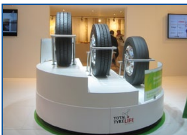
BRIDGESTONE - Oltre ai servizi di assistenza Total Tyre Care, il robusto pneumatico U-AP per autobus urbani.