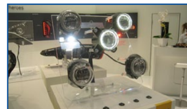
HELLA - Ha presentato la nuova serie modulare Shapeline di lampade a Led.