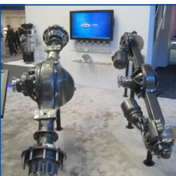
DANA - Anche per autobus da oltre 8 tonnellate i nuovi assali motore Spicer Compact Series Plus.