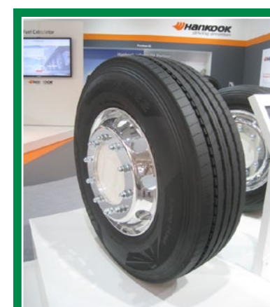
HANKOOK - Per i pullman a lunga distanza ora c'è il nuovo SmartTouring AL22 per tutte le posizioni degli assi, nelle misure 295/80 R 22,5 e 315/80 R 22,5.