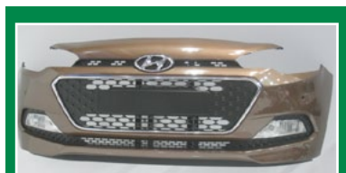
ASSAN HANIL - In Turchia realizza componenti in materiale plastico. Nuovo il sedile autista a sospensione pneumatica.