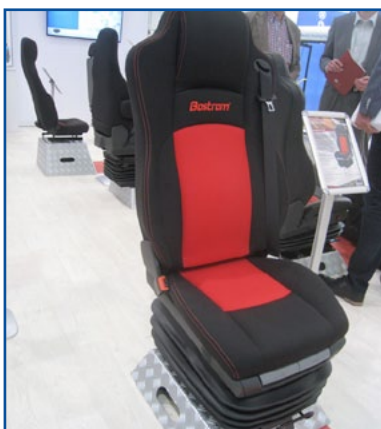
BOSTROM - Il nuovo sedile WP Bus pneumatico con valvola di memoria del posizionamento dell'autista.