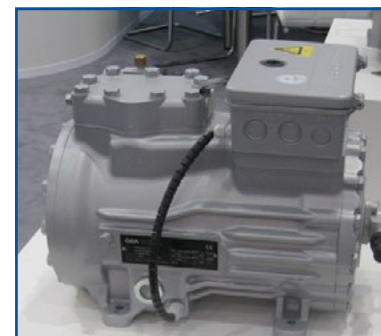
GEA - Compressori per impianti di aria condizionata su autobus anche ibridi ed elettrici.