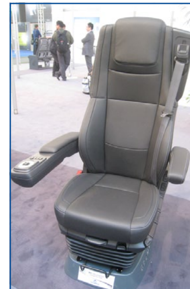
GRAMMER - Ha presentato il prototipo del nuovo sedile autista MSG 115 destinato all'aftermarket.